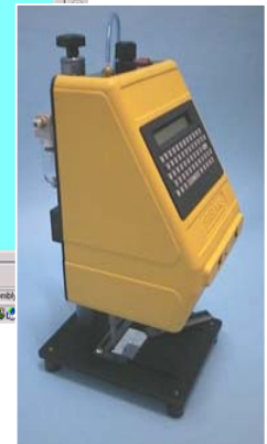
MOD. MK3-S1 / S5

“Utilizziamo il CAD 3D SOLID WORKS da 5 anni . La Sitel esprime la sua grande soddisfazione nel progettare con questo straordinario strumento per la sua semplicità di apprendimento, la flessibilità di utilizzo e la velocità realizzativa dei prodotti”