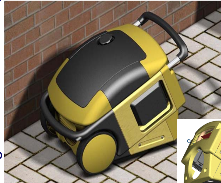
Generatore di corrente, modello C1200