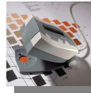
Colorimeter DTP 1150- Barbieri Electronics Design&Engineering : MM Design, Italy