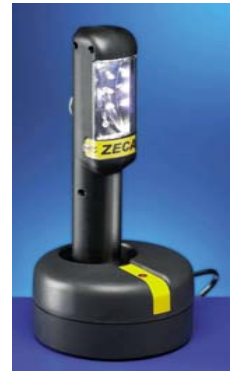
Lampada a led - 310