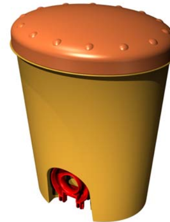
Portarifiuti a pedale