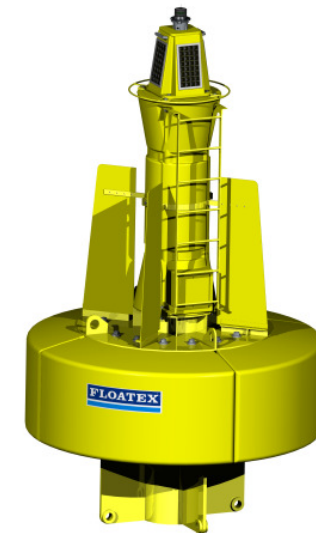
Boa segnaletica luminosa

“Grazie a Solidworks posso soddisfare le esigenze dei clienti in tempi più rapidi e con risultati migliori.”